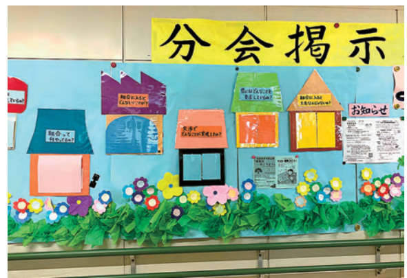
大きな掲示板にびっくり

交流会では、教員の長時間・過密労働は普通学校と変わらないことや18歳を過ぎると視覚障害の生徒の学べる環境が限られてしまうこと、視覚以外に知覚・身