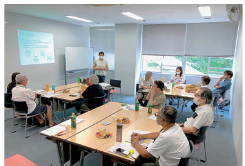
認知症について学習

学習後は、3班に分かれ、自己紹介から職場の悩みなどを出し合い、交流しましたが、2時間では