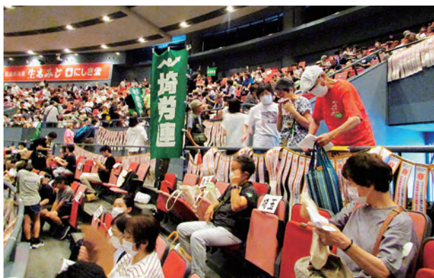
埼玉から150人以上が参加

なぜ戦争をなくし、平和を維持することがこんなにも難しい世界になっているのでしょうか。日本が軍事利権に組み込まれると、そこから抜け出すことは難しくなります。殺傷武器の輸出やジェノサイド・軍事進攻へはキツパリと反対を表明していきたいです。戦争を生き残った人はみんな「戦争はアカン」と云います。自身の悲惨