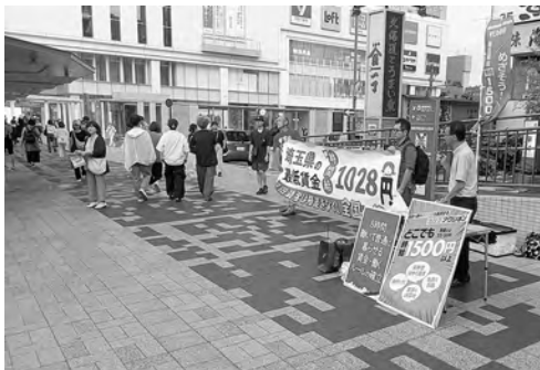
浦和駅東口で訴え

埼玉連の新しい最低賃金が50円引き上げられて1078円になることの周知と合わせて、「全国一律最賃制をつくり、時給は1500円に」、「物価高騰に負けない賃金水準の実現を」などと訴え、「声をあげて改善させよう」と、