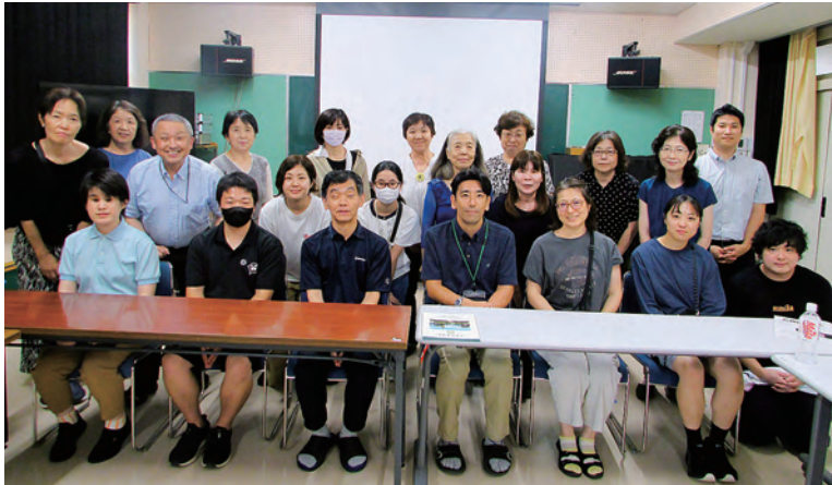
職場の仲間が大勢参加

埼保己一学園は、埼高教に加盟する最大分会の職場です。夏休み中で生徒は不在でしたが、授業の準備や意見交換会、