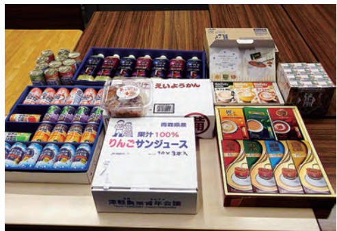
フードバンク第103便

今回は、埼玉土建国保組合から備蓄食品、コーヒーやジュースのギフトセットなど26・55キログラム、SUから梅干し、野菜ジュース、清涼飲料水など8・65キログラム、合わせて35・1キログラム