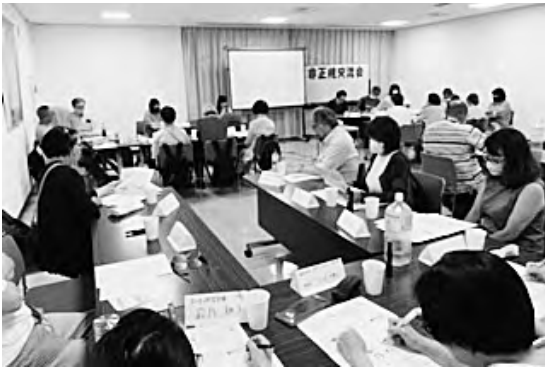
会場いっぱい の34人参加

コロナ以後、久しぶりの対面での集まりだったため、食べたいおやつを参加者に事前に選んでもらい、「もぐもぐタイム」を準備し