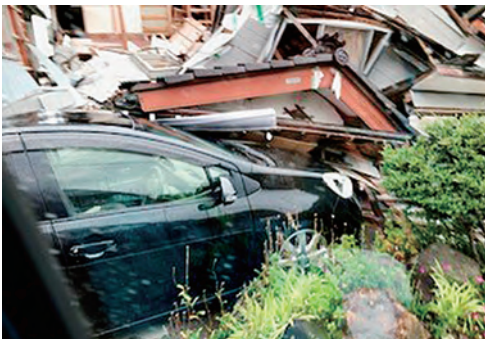
今も倒壊したままの家も多数

る公園へ。ここは津波被害にあったところで島は崩落し、軍艦が丸くそぎ落ちた状態になっていました。奥能登をつなぐ高速道路は片側通行でところどころ道路が崩れ、復旧の重機が動く中、右に左に折れながらの移動のため、往復6時間かけての行動でした。2日目は3軒から依頼(能登町と輪島市)があり、11人ずつでむかいました。埼玉連は輪島市へ。輪島診療所の事務長に頼まれてこちらも書籍やベッドなど必要なものを運び出す作業で終わりました。終了後は、港と朝市の火事現