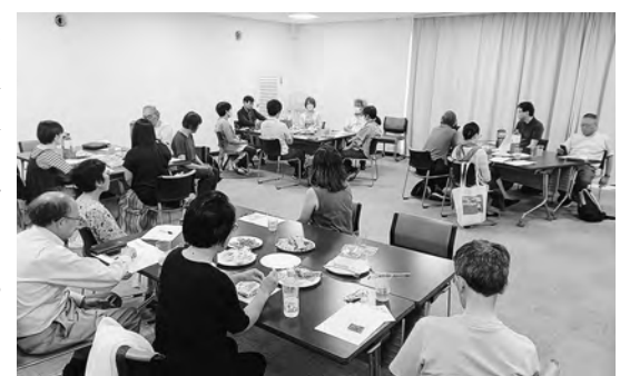
参加者どうして交流

他の参加者からパワハラ問題や労災認定、不当解雇撤回を求めて会社とたたかっている経験などが語られ、4つのテーブルに分かれての交流会、小内弁護士のな