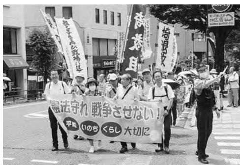
浦和駅までパレード