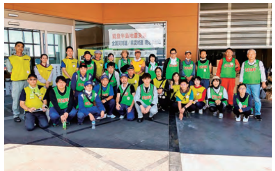
33人がボランティアに参加

ボランテアは切望されていますが、依頼者とのマッチングやセンターの態勢などもあり、全労連からの要請は月1回の設定になっています。第6次ボランテア募集は8月になります。埼玉連として検討し呼びかけますので、よろしくお願ひします。 また、7月10日(水)には三郷市労連から届いた玄米30キログラム、埼教組から届いたお茶、合計30・3キログラムを届けました。